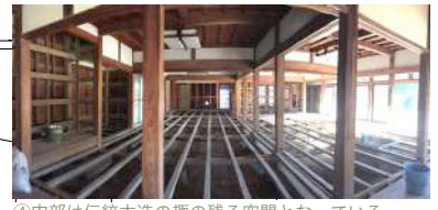
④内部は伝統木造の趣の残る空間となっている。