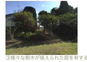
③様々な樹木が植えられた庭を有する

待合室を小さな図書館にする かつての待合室は、周辺住民の記憶が残るため、当時の雰囲気を残した計画とする。周辺の住民に呼びかけ、本を持寄ることにより、小さな図書室をつくる。